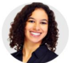
Nouveau chef d'entreprise