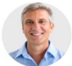
Professionnel de la création d'entreprise