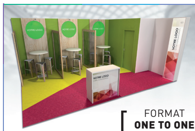
FORMAT ONE TO ONE

Configurez votre espace pour présenter vos produits et services à une assistance qualifiée.