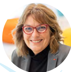
Cécile de Saint Michel

Présidente du Conseil national de l'ordre des experts-comptables