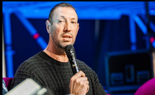
Alain Bernard - Double Olympic swimming champion