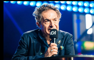
Etienne Klein - CEA