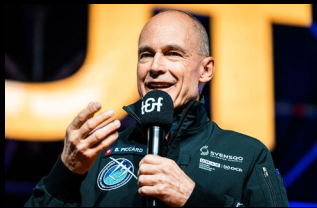
Bertrand Piccard - Climate Impulse