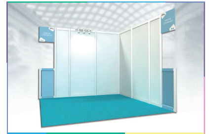
Visuel non contractuel

L'exposant les prend à sa charge via le Service Exposant : https://lesechossalons.managerexpo.com/