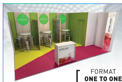
FORMAT ONE TO ONE

Configurez votre espace pour présenter vos produits et services à une assistance qualifiée.