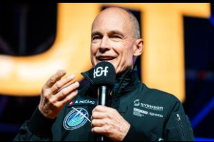
Bertrand Piccard - Climate Impulse