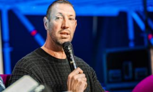
Alain Bernard - Double Olympic swimming champion